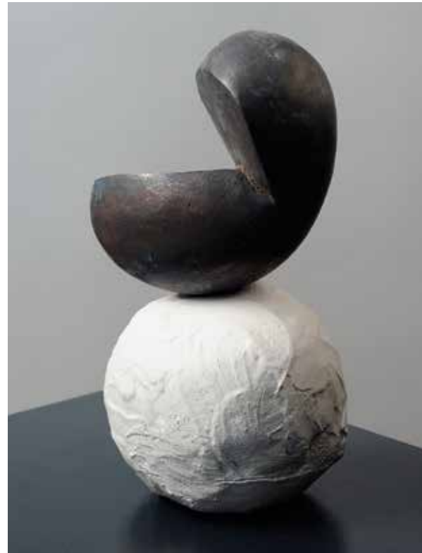
CLAUDIA HOFFMANN „on top“, 2015, Bronze, Kunststein, 20 x 13 x 13 cm

„ICH LIEBE DIE INSZENIERUNG EINFACHER FORMEN.“ CLAUDIA HOFFMANN