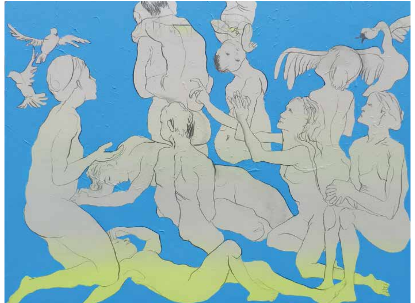
VANESSA VON WENDT Tragendes Gewicht, Taube Zukunft, Stand ich, immer ohne dich, II, Ausschnitt, 2015, Acryl und Kohle auf Leinwand, 150 x 200 cm

„WENDT VERBILDLICHT IN IHREN GEMÄLDEN VERSCHIEDENTLICHE ASPEKTE MENSCHLICHEN UND DINGLICHEN SEINS.“ SIMONE RIKEIT